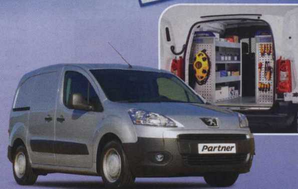
Abb. enthält Sonderausstattung